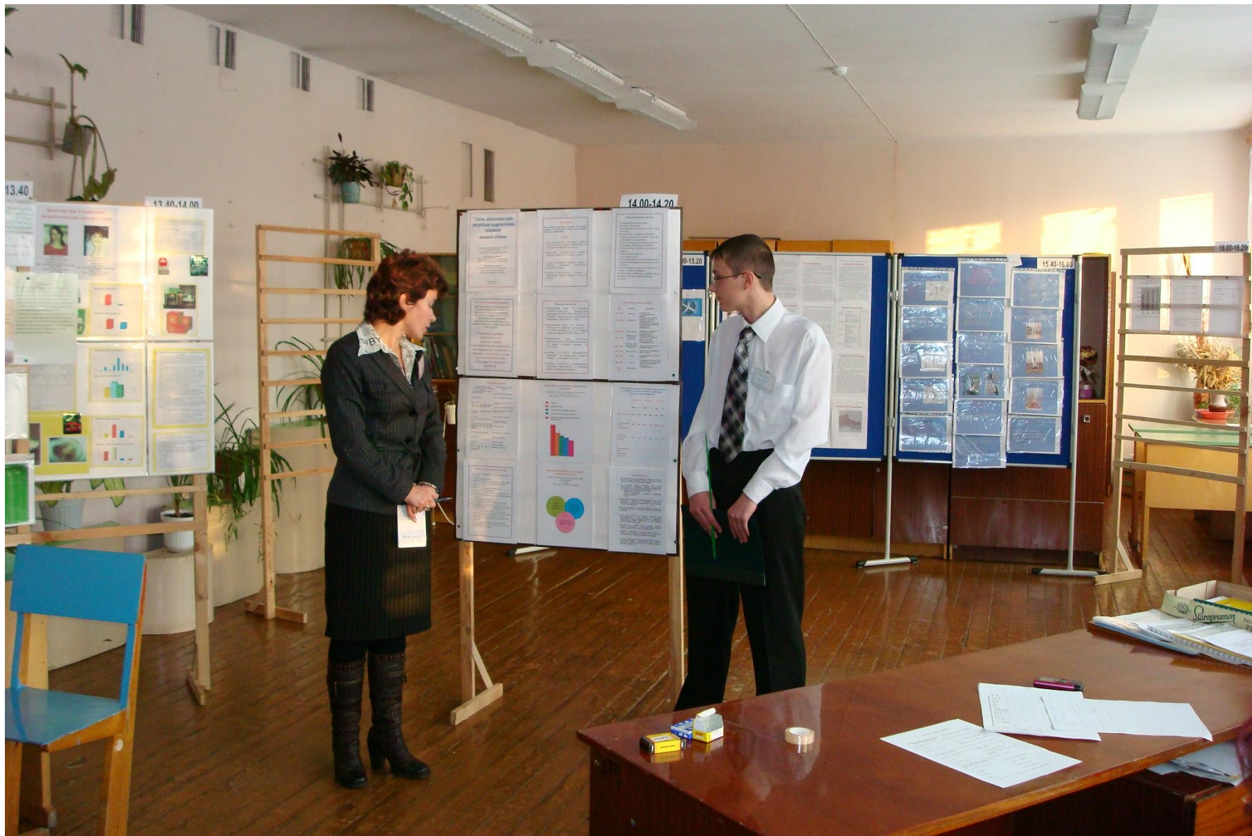
Республиканская конференция ЮниОС