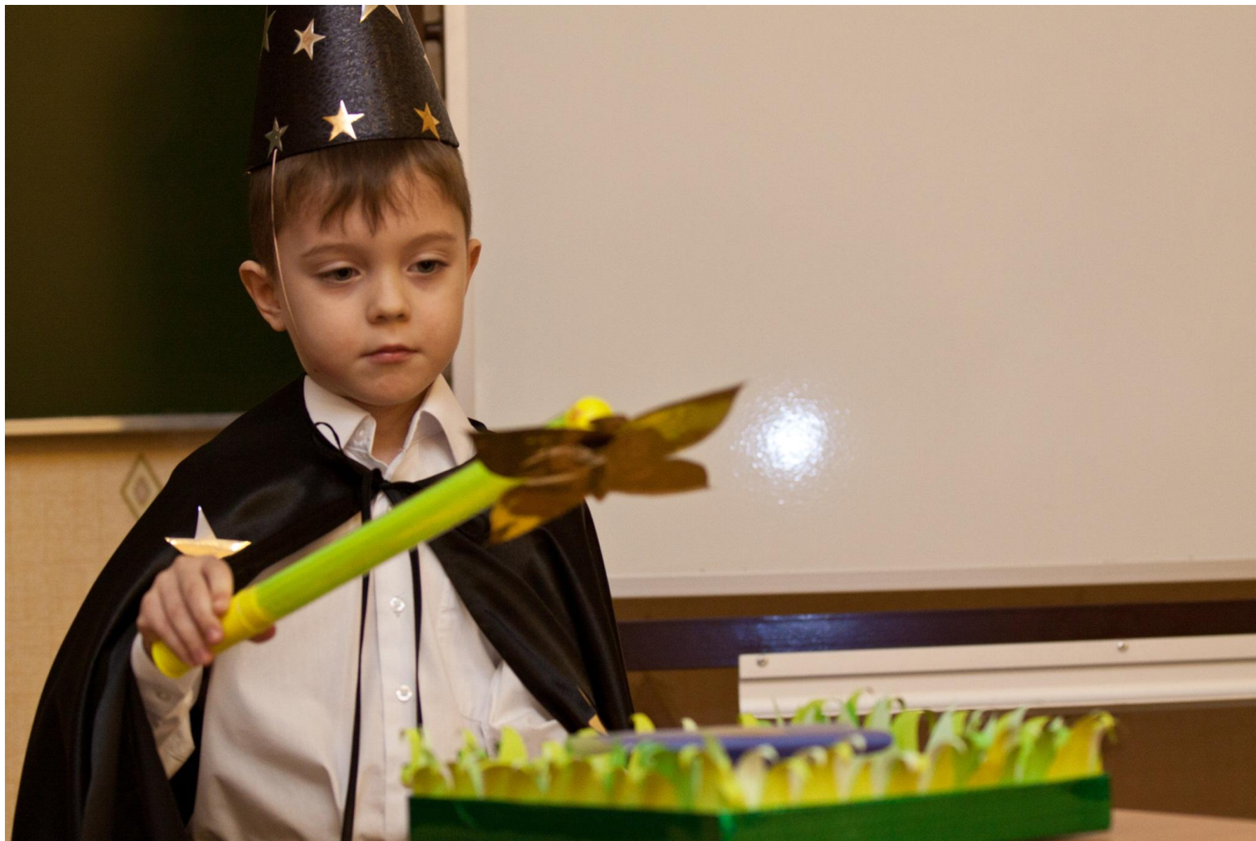
Фестиваль творческих проектов МОУДОД «ДТДиМ»