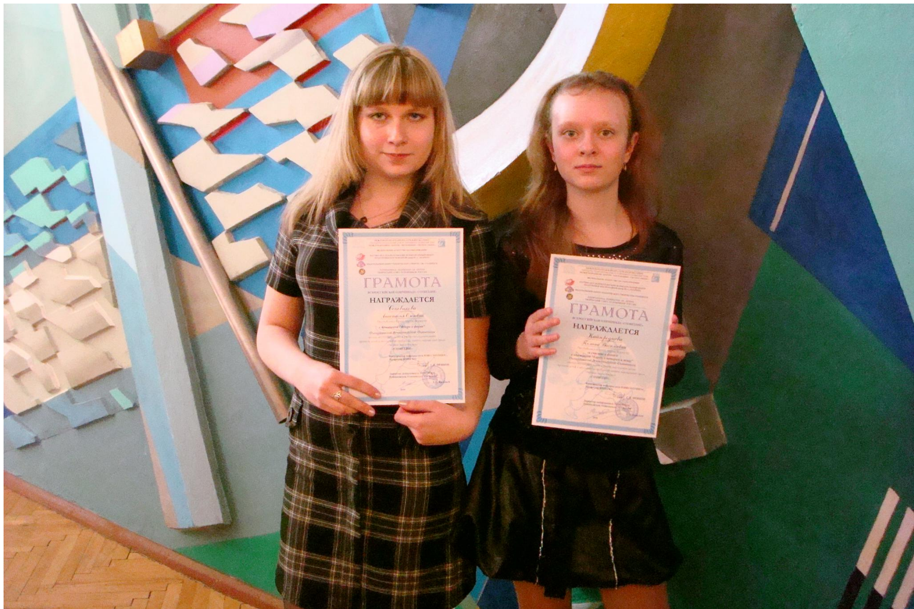
Всероссийская олимпиада «Созвездие»