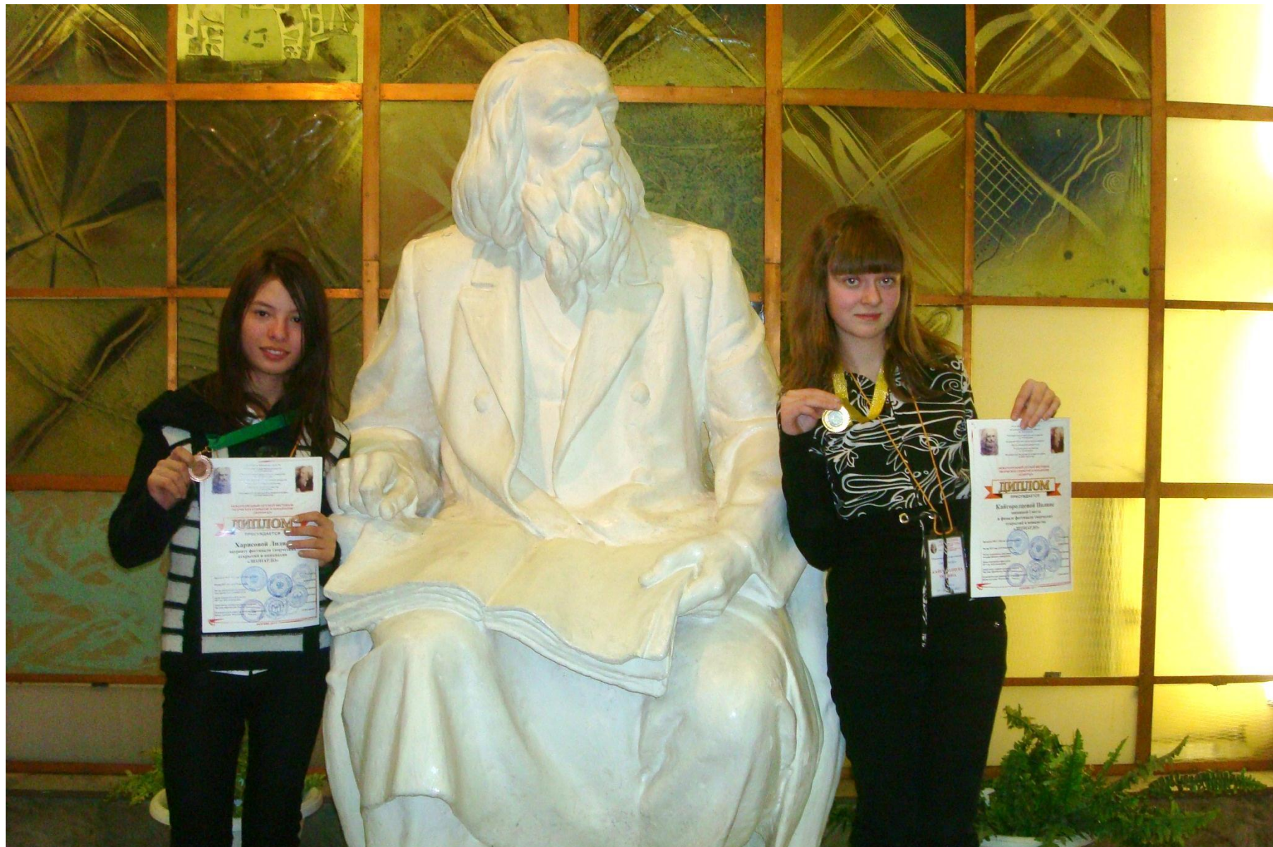
Международная конференция «Леонардо»